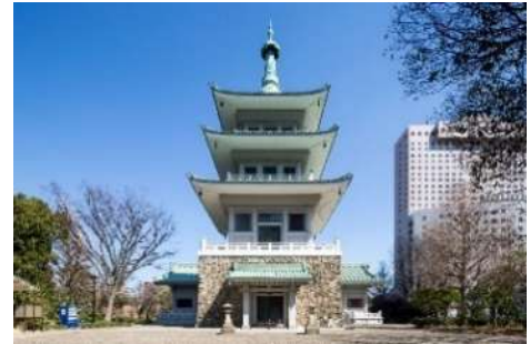
東京都慰霊堂・納骨堂

本所、深川、城東などの東京下町は、大正・昭和の時代に大地震と大空襲という史上最大の犠牲者を出した土地であり、またこのような災害にも関わらず、逞しく復興を遂げた、私たち日本人が忘れてはならない記憶の場所でもあります。ツアーは、東京都慰霊堂納骨室の特別見学から始まり、被災の記憶の場所や慰霊のために建立された観音・地蔵を辿りながら、災難から逃れることができたという清澄公園まで歩きます。新しい下町の表情も楽しみながら両国・菊川・森下・清澄白河を巡ります。