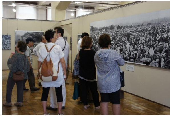
復興記念館の見学風景

ぜひ一人でも多くの方がこの復興記念館に足を運んで頂き、震災・戦災の悲劇と共に、これからの平和や防災について考える機会を提供できればと思います。