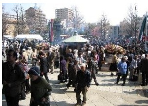
昨年の慰霊堂前の風景